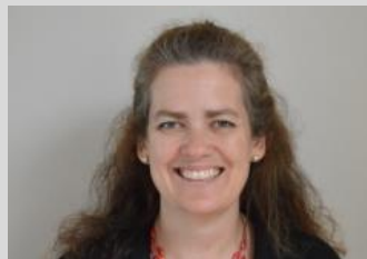
Körledare Haga Sång & Spel: