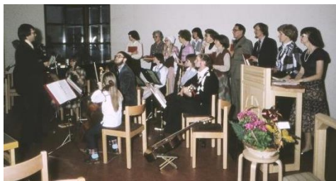
Bild tagen från festkvällen innan invigningsgudstjänsten